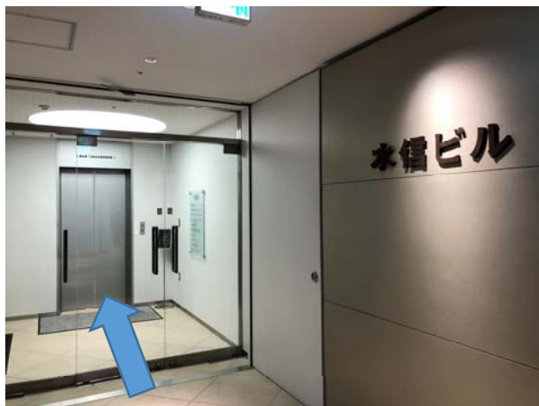
7. 真っすぐ進み水信ビルのエレベーターに乗る