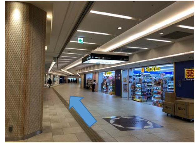
3. 右側にマツモトキヨシが見えてくる。真っすぐ進む