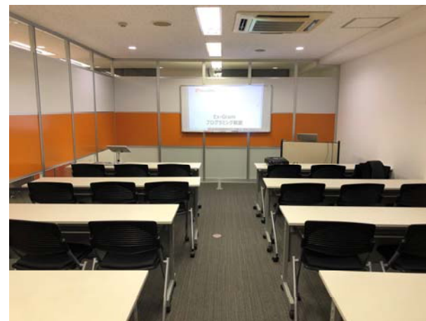
9. セミナールーム内の様子