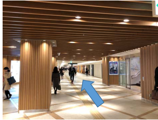
2. 左側に有隣堂が見えてくる。真っすぐ進む