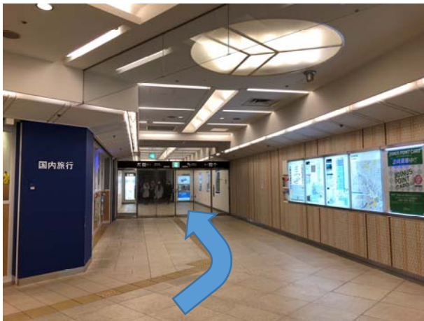
4. 道なりに左にカーブし一番奥まで行く