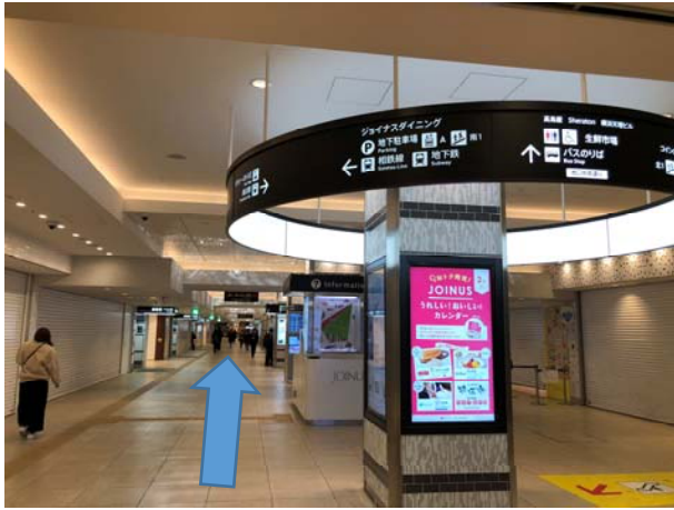
1. 横浜駅西口の地下街に入り真っ直ぐ進む